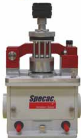
シールド加熱型ATR装置(空冷式)