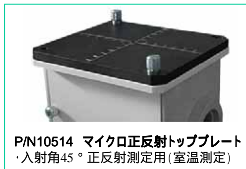
P/N10514 マイクロ正反射トッププレート ・入射角45° 正反射測定用(室温測定)