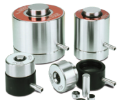
排気ポート付ペレットダイス 赤外測定用 KBr 錠剤、蛍光 X 線測定用ペレット等の作成に