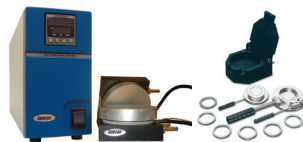
加熱プラテン (Max. 300°C) ・定厚フィルムメーカー 油圧プレスを加熱プレスとして使用できます